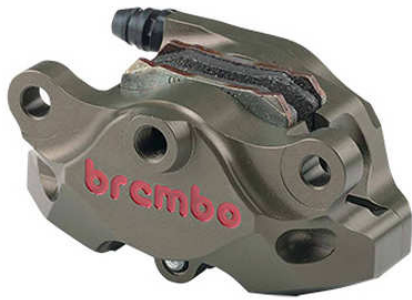
Rear CNC Caliper Kit 2P ハードアナダイズド 120.A441.10