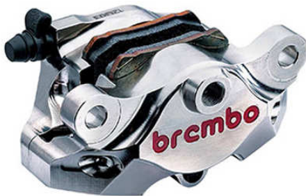
Rear CNC Caliper Kit 2P ニッケルコーティング 120.A441.40