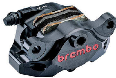
Rear CNC Caliper Kit 2P ブラックアルマイト 120.A441.30