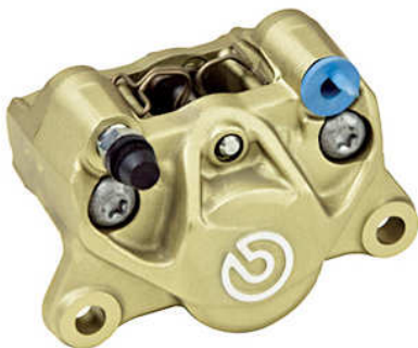
P2 34 Cast Rear Caliper ゴールド (新カニ) 20.B852.10