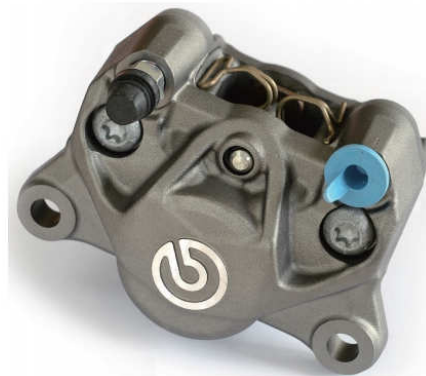
P2 34 Super Sports Cast Rear Caliper チタニウムカラー 20.B852.70

該当のユーザー様はお買い求めの販売店様にご連絡いただくか下記代理店までご連絡下さい。