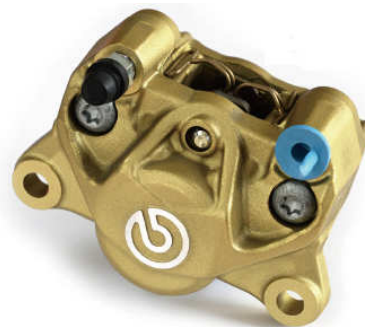
P2 32 Cast Rear Caliper ゴールド (新カニ) 20.B851.11